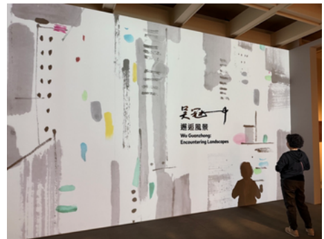
2026年3月14日，單位帶領會員前往藝術博物館，透過欣賞各類藝術作品，放慢步伐，感受心靈的沉澱與滋養。

於3月14日舉行的「藝術漫步·古蹟尋蹤」活動，共有28位照顧者及家屬參與。行程內容則以文化與藝術為主軸，帶領參加者走訪本地歷史建築及文化景點。活動過程中加入輕度步行及觀察任務，讓參加者在城市空間中細味生活，並透過藝術與環境的連結，開拓感官經驗，同時讓他們建立交流與支持，營造出一個彼此理解與陪伴的空間。