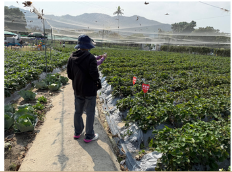
2026年3月7日，中心帶領會員前往郊外農場採摘士多啤梨，享受片刻放鬆與自然時光。

於3月7日舉行的「綠色生態·海鮮品嚐」一日遊活動，共有57位照顧者及其家屬參與。當日行程包括走訪塋原自然生態公園，讓參加者在廣闊而寧靜的自然環境中放鬆繃緊的身心；隨後我們前往流浮山海味街，感受地道社區文化，並安排自由時間於農莊體驗摘水果活動，讓參加者能暫時放下照顧者的角色，重新調整呼吸與步伐。