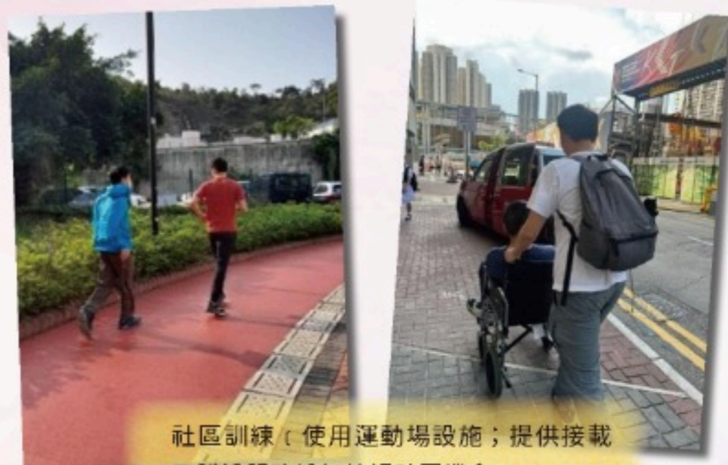
社區訓練（使用運動場設施；提供接載及護送服務增加接觸社區機會）

離校生專隊為畢業生安排不同的社區訓練活動，與他們一同使用社區設施（例如超級市場、運動場等），學習遵守社區規範，提升自理能力，並增加與社區人士的互動，從而建立更大的生活自主權。