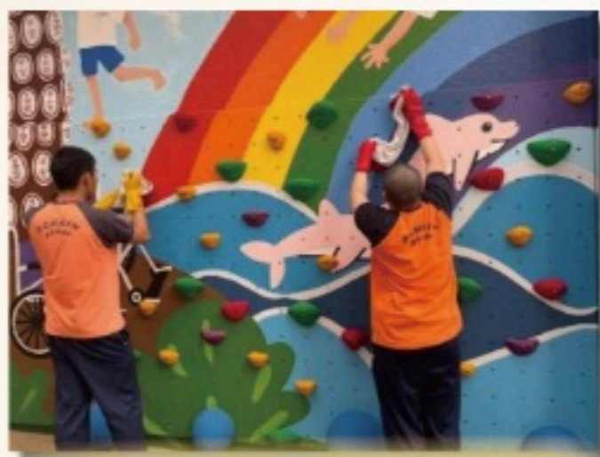
實習體驗（高中生體驗清潔工作）

我們與學校、本地社區企業及成人服務機構合作，為離校生提供短期實習機會，讓他們在真實的工作環境中嘗試與適應，包括了解工作流程、人際溝通技巧、職場規範等。這些寶貴經驗不僅有助於他們探索未來的職涯方向，更能強化社交能力與正面工作態度，為將來融入職場打好基礎。