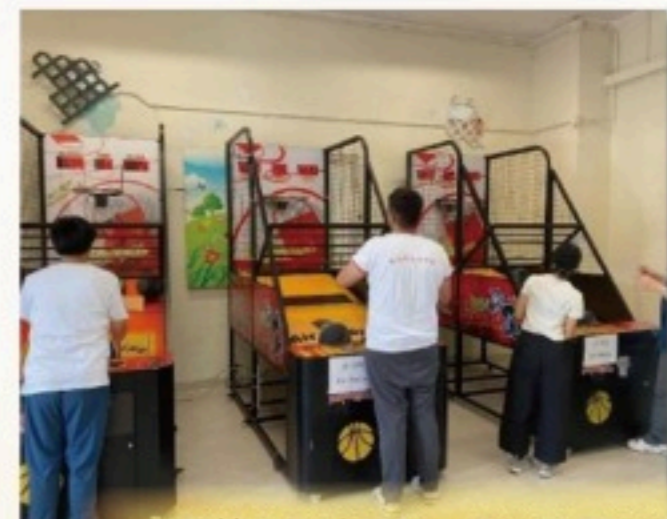
離校生聯誼活動（香港西區扶輪社 匡智晨輝學校及賽馬會匡智學校）