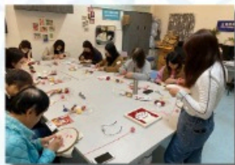
照顧者〈毛毯戳戳繡〉手工活動 (合作學校：香港紅十字會甘迺迪中心)

照顧者在日常生活中承受着沉重的照顧壓力，常常忽略了自己的情緒與需要。為了讓照顧者得到喘息與療愈，專隊與學校合作舉辦不同的身心靈紓壓活動，透過藝術創作——如皮革工藝、藍染體驗、藍曬工作坊、肌理畫創作等，讓照顧者在專注與創作中釋放壓力，重新與自己連結，找回內在平衡與能量。