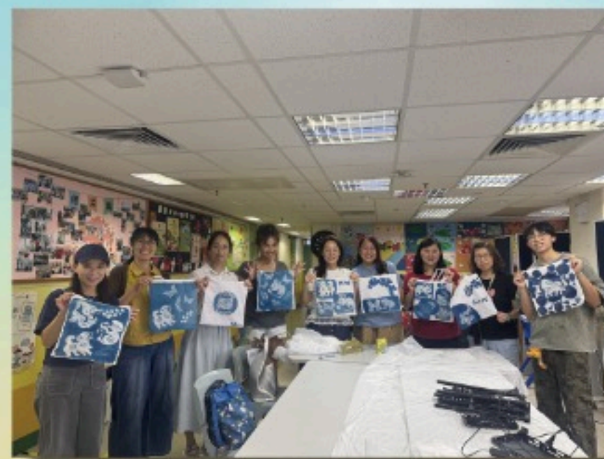
照顧者〈藍曬〉工作坊 (合作學校：香港西區扶輪社區智晨輝學校)

照顧者在日常生活中承受着沉重的照顧壓力，常常忽略了自己的情緒與需要。為了讓照顧者得到喘息與療癒，專隊與學校合作舉辦不同的身心靈紓壓活動，透過藝術創作——如皮革工藝、藍染體驗、藍曬工作坊、肌理畫創作等，讓照顧者在專注與創作中釋放壓力，重新與自己連結，找回內在平衡與能量。