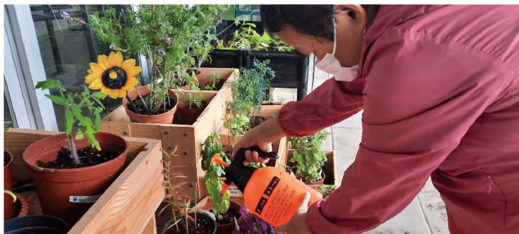
會員每日澆水令草木茁壯成長