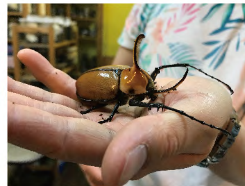
照顧甲蟲培養愛心和耐性