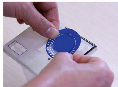
設計輔助模具，方便復康會員參與生產