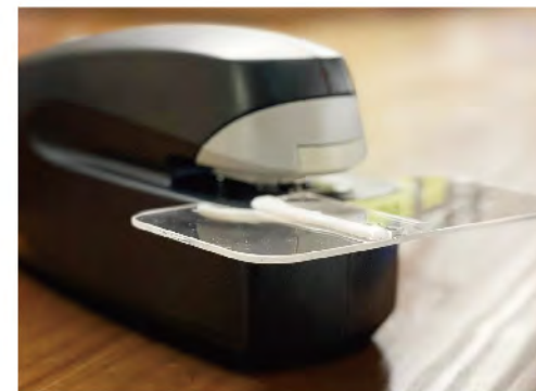
單手使用的釘書機

透過設計輔助工具，讓復康人士能夠不受限制而參與各式各樣的工種，投入工作再建立信心，踏出重投社會重要的第一步。