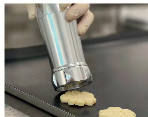
使用烘焙器具使復康人士能參與生產