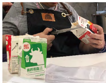
企業選用我們的再造紙印製嘉許狀