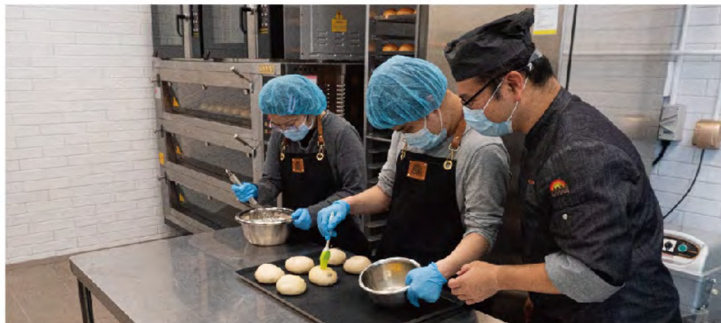
由專業糕餅師設計烘焙實習內容，提升會員烘焙能力

由專業糕餅師為復康人士設計多元化烘焙實習：糕餅、節日禮盒、派對甜點。配合工具及機器使用，讓復康人士都能夠參與生產。