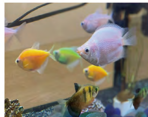
觀察魚兒慢游感覺平和怡情養性